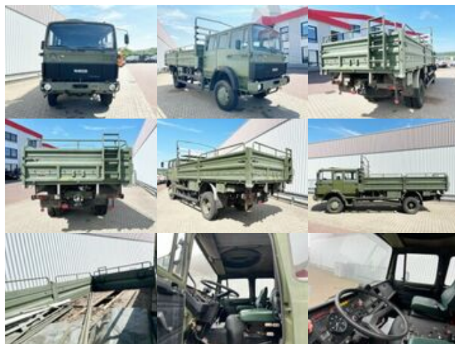
Iveco-Magirus 110-17 WA 4x4 Doka, Pritsche