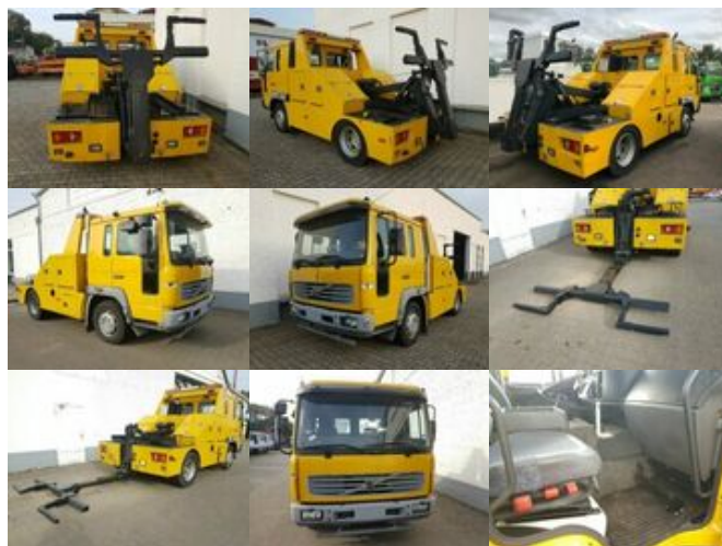
Volvo FL 612 L, Abschleppwagen Hubbrille 3 to

Prijs (bruto): 26.005,32 € BTW 21%: 4.513,32 €