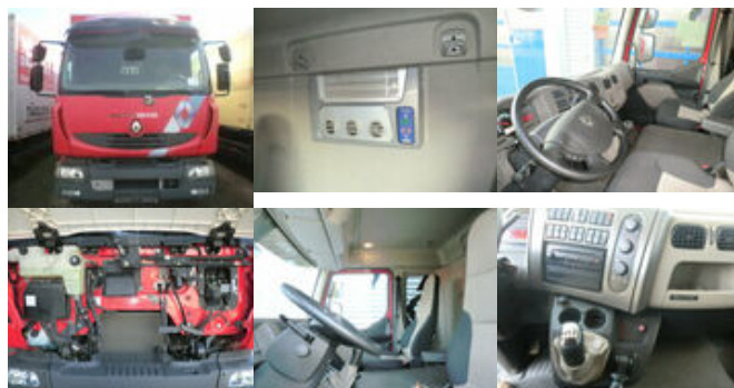
Renault Midlum 220 DXi 4x2

Prijs (bruto): 37.766,52 € BTW 21%: 6.554,52 €