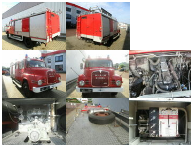
MAN 450 HALF TRO-TLF 16