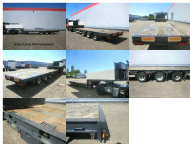
Schwarz Müller STP 3/ZV-N, 3-Achse nachlauf gelenkt, mit 6x Twist Lock

Prijs (bruto): 18.164,52 € BTW 21%: 3.152,52 €