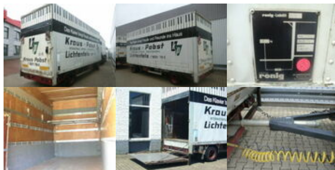
SOMMER Sommer AC 160 TL, Möbelkofferaanhänger, LBW, 55cbm

Prijs (bruto): 7.710,12 € BTW 21%: 1.338,12 €