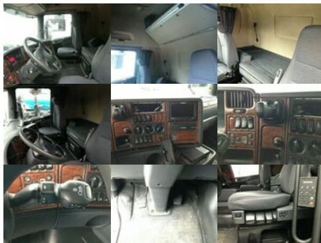
Scania R420 4x2 Lowliner, Twin Tec Rußfilterkat

Prijs (bruto): 15.550,92 € BTW 21%: 2.698,92 €