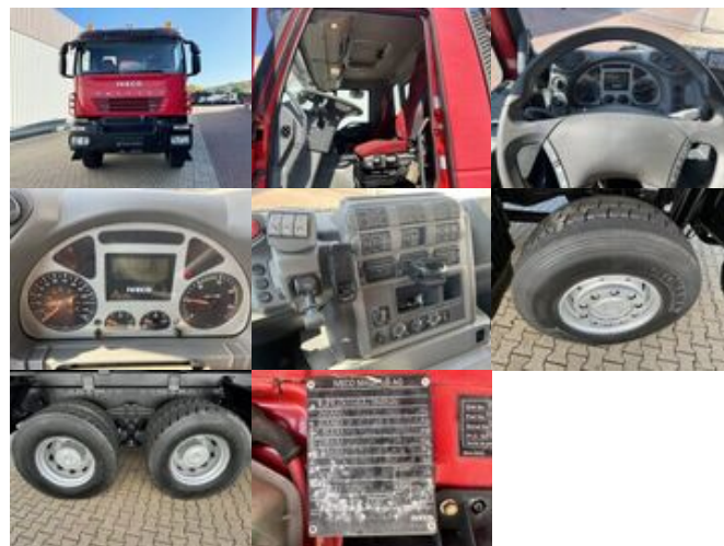
Iveco-Magirus AD260T45W 6x6

Prijs (bruto): 53.578,80 € BTW 21%: 9.298,80 €