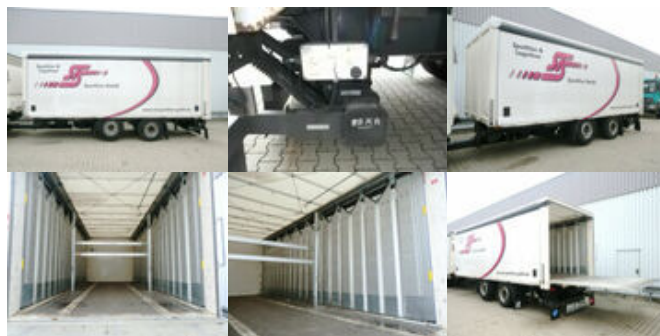
Ackermann Z-PA-F 18/7.4 E

Prijs (bruto): 14.244,12 € BTW 21%: 2.472,12 €