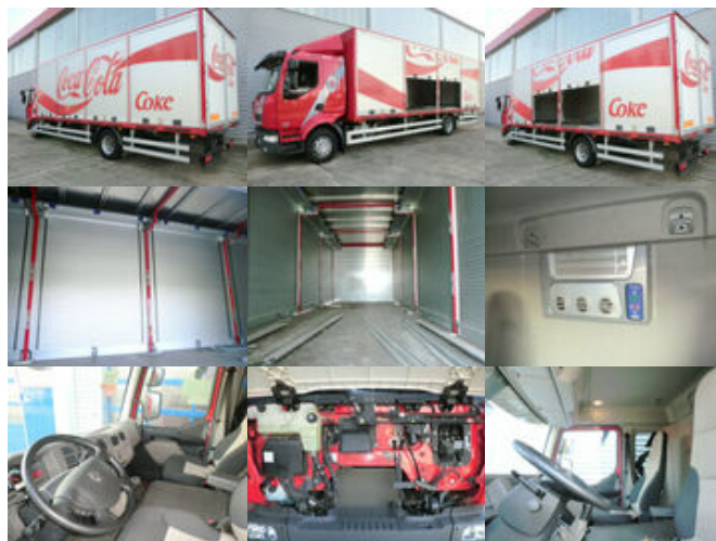
Renault Midlum 220 DXi 4x2