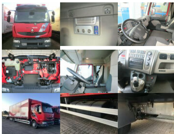
Renault Midlum 220 DXi 4x2 Chassi Länge 7,5 m

Prijs (bruto): 41.686,92 € BTW 21%: 7.234,92 €