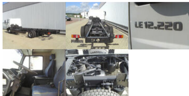
MAN LE 12.220 BL 4x2, Ersatzteilträger!

Prijs (bruto): 7.710,12 € BTW 21%: 1.338,12 €