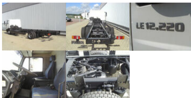
MAN LE 12.220 BL 4x2, Ersatzteilträger!

Prijs (bruto): 7.710,12 € BTW 21%: 1.338,12 €