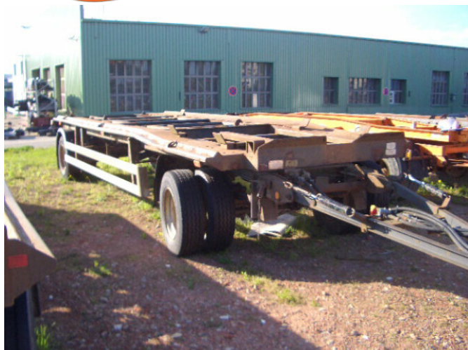
GEORG, NEIT. Georg GLI 12-51 KO

Prijs (bruto): 6.403,32 € BTW 21%: 1.111,32 €