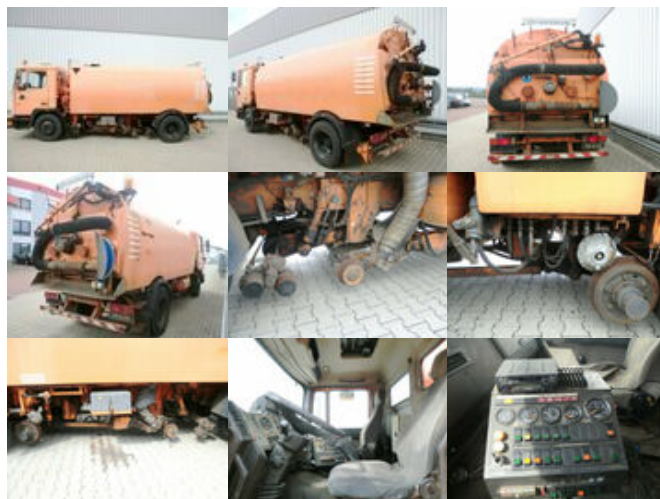
MAN M03 14.152 4x2, Schienenkehrmaschine

Prijs (bruto): 14.244,12 € BTW 21%: 2.472,12 €