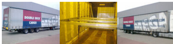
Hoffmann HSE, Jumbo, Mega

Prijs (bruto): 7.710,12 € BTW 21%: 1.338,12 €