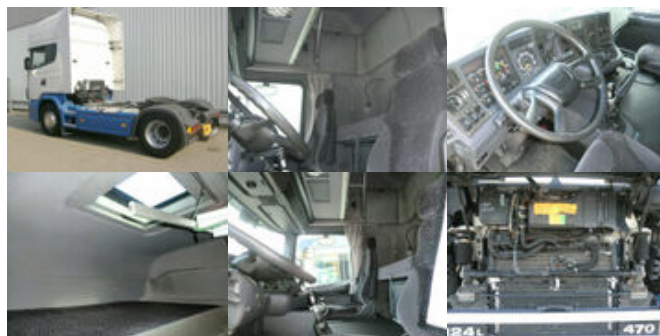
Scania 124R470 4x2, Kipphydraulik

Prijs (bruto): 15.550,92 € BTW 21%: 2.698,92 €