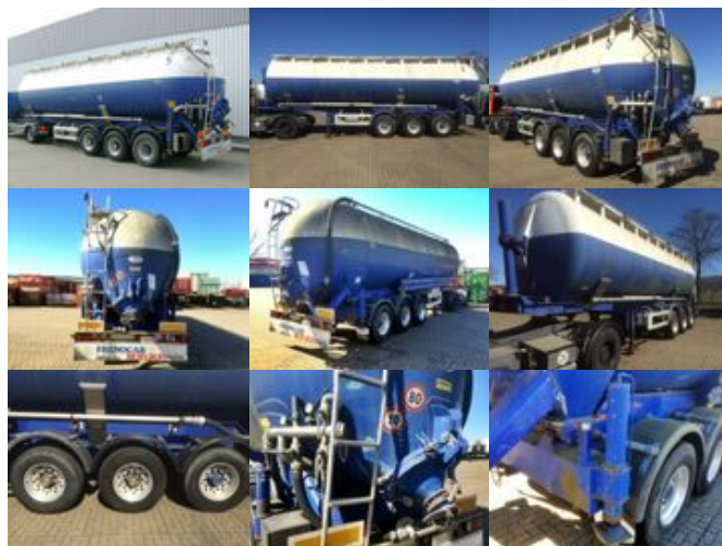
Mistrall MISTRAL Kippsilo, ca. 49m 3