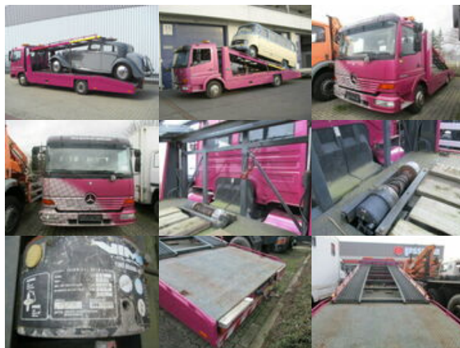
Mercedes-Benz Atego 817L 4x2, Autotransporter, 2x VORHANDEN!

Prijs (bruto): 20.778,12 € BTW 21%: 3.606,12 €