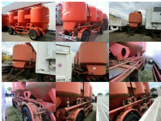
Koehler KOEHLER B16/3, ca. 23.250l, 3 Kammern

Prijs (bruto): 8.102,16 € BTW 21%: 1.406,16 €