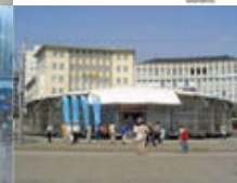
Wille WILLE SAK17 mobile Ausstellungshalle Mega Jumbo