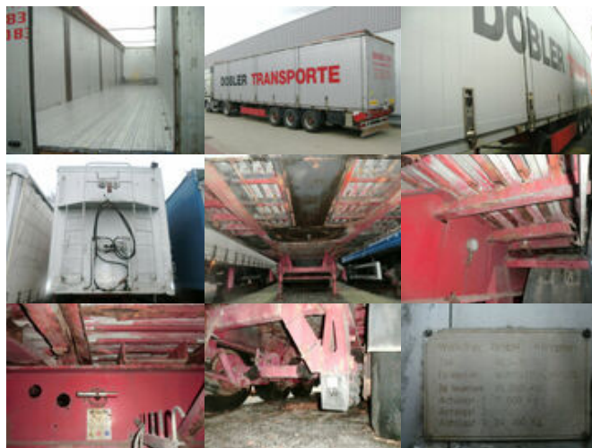
WALKLINER WALKLINER WLS 35/24, Walkingfloor mit Klappen linke Seite ca. 87m 3

Prijs (bruto): 12.937,32 € BTW 21%: 2.245,32 €