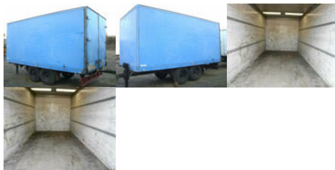
Ackermann-Frühaufr TPW A8,6/5,6E

Prijs (bruto): 5.880,60 € BTW 21%: 1.020,60 €