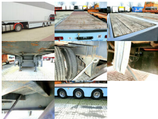
Zorzi ZORZI (I) Tiefplader-Auflieger

Prijs (bruto): 11.630,52 € BTW 21%: 2.018,52 €