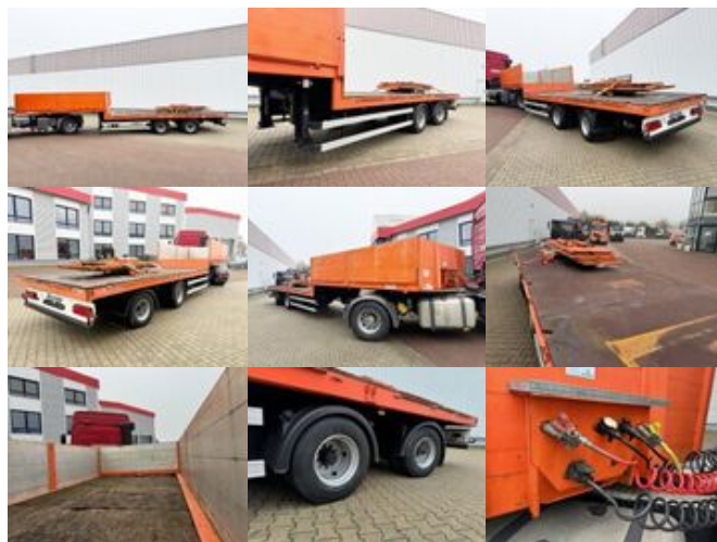
SCHROEDER,W. Schroeder S 11/18 P2 - 11,20, Zwangsgelenkt

Prijs (bruto): 22.084,92 € BTW 21%: 3.832,92 €