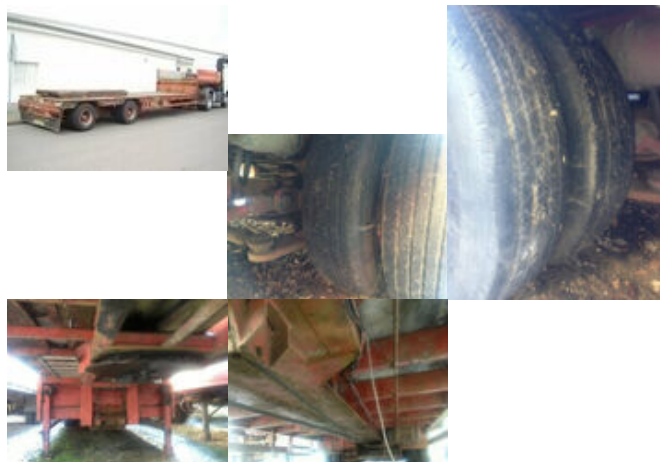
Goldhofer STPA T2-22/80A zwangsgelenkt

Prijs (bruto): 15.550,92 € BTW 21%: 2.698,92 €